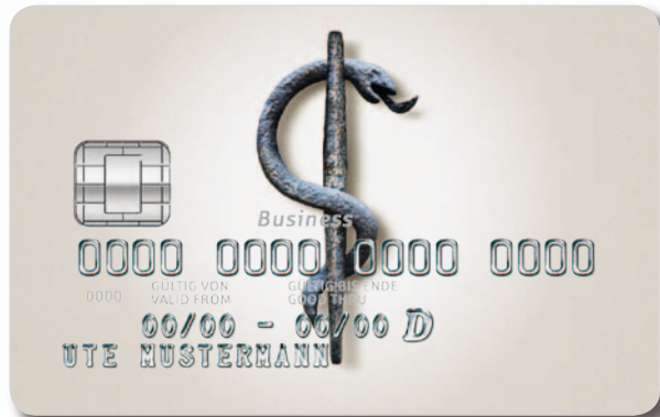
Äskulapstab | 750029029900025