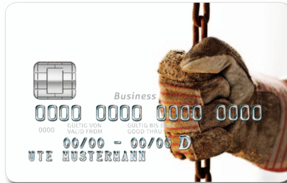
Zu- & Anpacken | 750029029900033