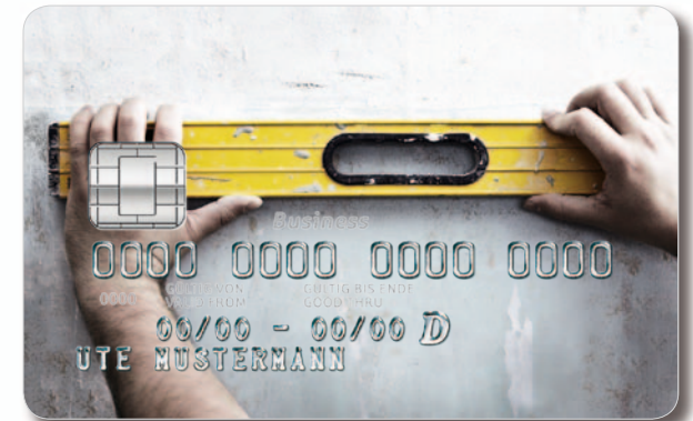
Wasserwaage | 750029029900017