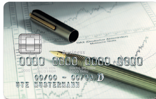
Börsenkurse (Business) | 750029029900082