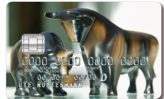
Bulle & Bär (Business) | 750029029900074