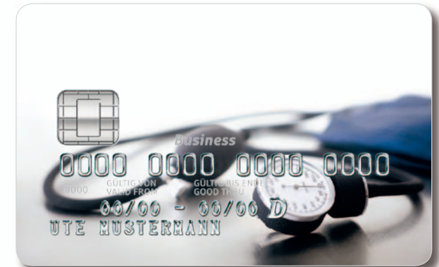
Blutdruckmessgerät | 750029029900058