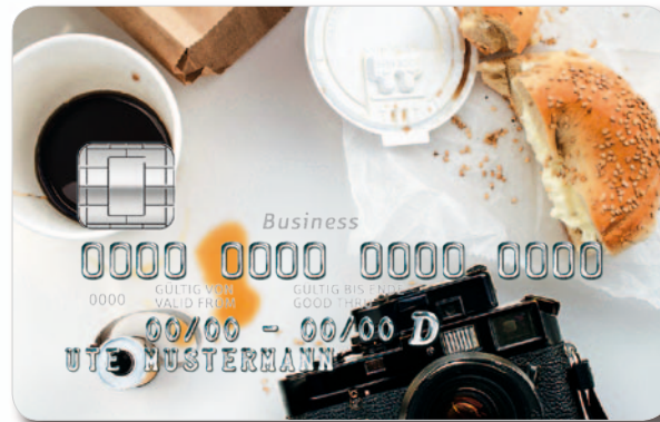
Selbständig & Kreativ | 750029029900108