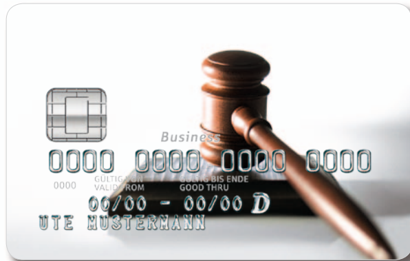
Verhandlung & Entscheidung | 750029029900009